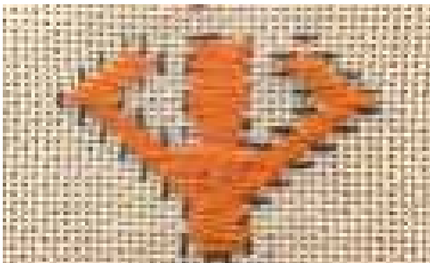
تصویر ۴. نقش گیاهی سروک (سرو کوچک).

روابط استعاری شود. در این مفهوم تصویر روشی برای دیدن گونه‌های از تصویر به جای گونه‌های دیگر است. زیرا «استعاره» ۱۲ در اصل به معنای انتقال دادن است و نقوش استعاری و تجریدی توانایی بیان پدیده‌ها و معانی غایب را دارند» (سامرز به نقل از گات و مک‌ایور، ۱۳۹۳، ۲۱۲). به همین دلیل شناخت مفاهیم نمادین نقوش هنرهای سنتی بسیار پیچیده است و همواره فرضیات گوناگونی درباره آن مطرح خواهد بود.