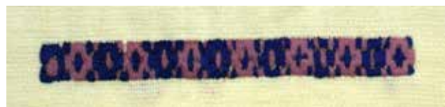
تصویر ۶. موسم (فصل) قریب.