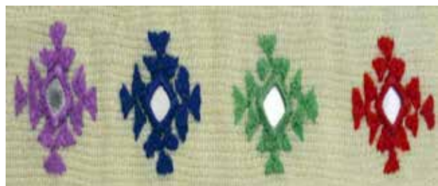
تصویر ۷. نقش هندسی بکالوک.