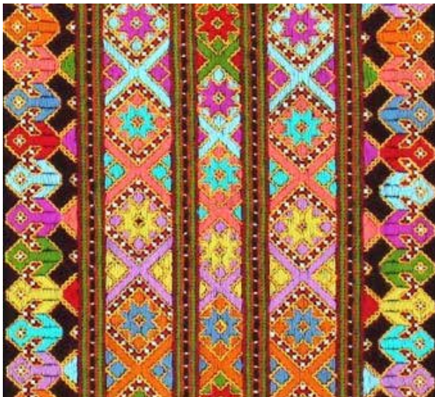
تصویر ۹. نمونه‌ای از ریتم متناوب در سوزن‌دوزی بلوچ.

و آبی می‌توانند مکمل هم باشند. قرمز و سبز تضاد مکمل ۲۱ و قرمز و آبی با هم تضاد همزمانی ۲۲ و فام برقرار می‌کنند. در مجموع نیز می‌توان در ترکیبات رنگی سوزن‌دوزی بلوچ کنتراست فام ۲۳ را تشخیص داد. ترکیب رنگ‌های به کاررفته در سوزن‌دوزی بلوچ را می‌توان از طریق صفاتی چون پرقدرت، زنده و نیروبخش توصیف کرد (ساتن و والان، ۱۳۹۲).