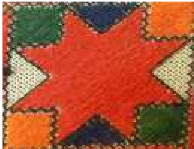
تصویر ۵. گل سهر (سرخ) نمونه‌ای از نقوش گیاهی سوزن‌دوزی بلوچ. می‌توان این نقش را برگرفته از خورشید نیز دانست که در گذر زمان به عنصری گیاهی نسبت داده شده است.

بافت ۱۷ را به لحاظ تراکم می‌توان به انواع متراکم و نیمه‌متراکم تقسیم‌بندی کرد. بافت در سوزن‌دوزی بلوچ از طریق تراکم، تکرار و ترکیب انواع خط‌ها و اشکال هندسی در کنار بافت رنگی به‌وجود می‌آید. در زیبایی‌شناسی بلوچی‌دوزی، به‌صورت منفرد، می‌توان بافت سوزن‌دوزی را از نوع متراکم دانست. اما از آنجا که اساس کاربرد این سوزن‌دوزی‌ها در تزئین پوشاک است، باید به جلوه بافت این سوزن‌دوزی‌ها در لباس‌های بلوچی نیز توجه کرد