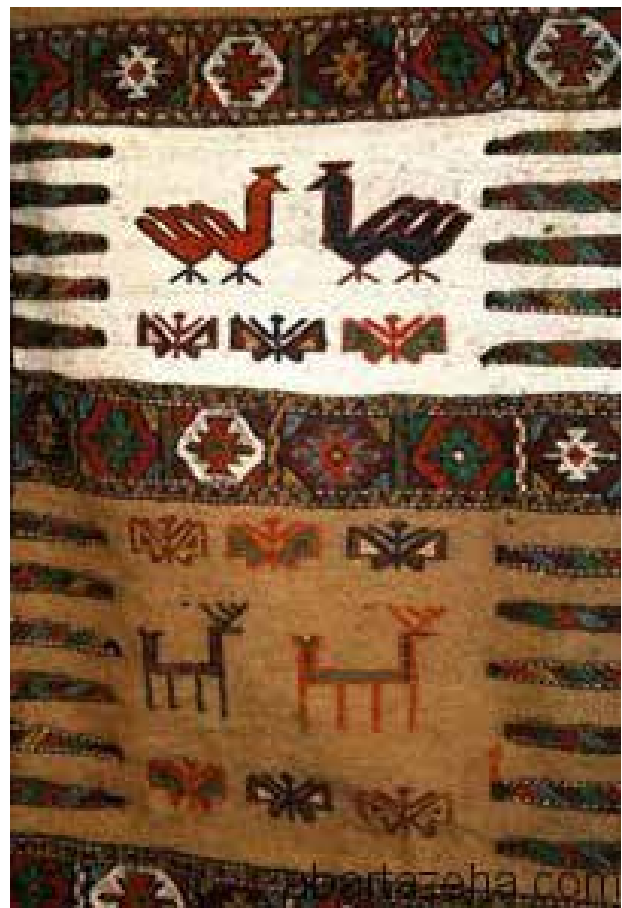
تصویر ۱۲. نمونه‌ای از گلیم عشایر کهگیلویه و بویراحمد با نقوش حیوانی تلخیص‌شده به گونه‌ای که به انتزاع و تجرید محض نرسیده و مضمون نقوش قابل تشخیص است. مشابه چنین نقوشی را نمی‌توان در سوزن‌دوزی‌ها و یا دیگر هنرهای بومی بلوچ مشاهده کرد.