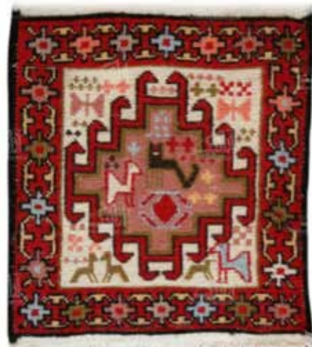
تصویر ۱۰. یک نمونه ورنی، گلیم سوزنی از اردبیل با نقوش هندسی و خطوط راست.

با توجه به اهمیت سمبولیسم در نقوش هندسی و براساس معنای تجرید و انتزاع که پیش‌تر مورد اشاره قرار گرفت،