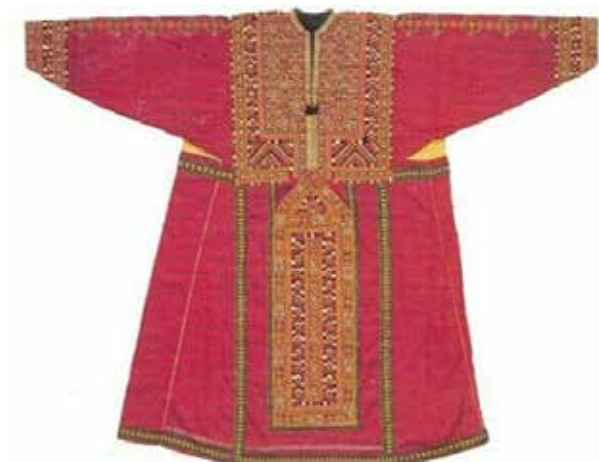
تصویر ۸. پیراهن زنانه سوزن‌دوزی شده بلوچ.

همان‌گونه که مشاهده می‌شود، در انواع نقوش به‌کاررفته در این سوزن‌دوزی‌ها تمامی خطوط صاف و زاویه‌دار هستند و به‌ندرت می‌توان خطی منحنی در آنها یافت. عوامل مختلفی را به‌عنوان بن‌مایه‌های مؤثر بر شکل‌گیری این نقوش معرفی کرده‌اند. به‌صورت کلی نوع طبیعت، آب و هوا، ذهنیات، روحیات و آداب و رسوم را در تعیین نوع نقش مؤثر و همین مسئله را دلیل تفاوت دوخت و نقش هر منطقه با منطقه دیگر می‌دانند. ۱۵ اما در کل دوخت این نقوش بر پایه شمارش تارهای پارچه بوده و به‌همین دلیل از پارچه‌هایی با تار و پود عمود برهم در آن استفاده می‌شود.