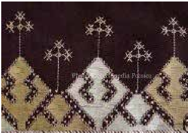
تصویر ۳. نقش مرگ (مرغ) پانچ (پنجه)، مشابه پنجه مرغ.