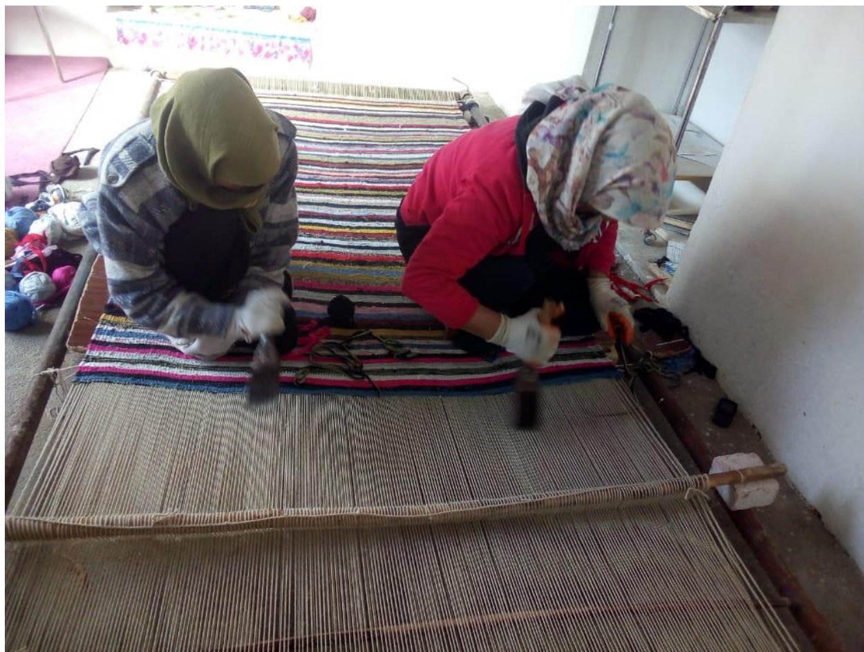
مرحله چهارم: شانه زنی (۵)