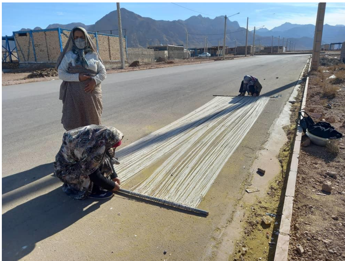
مرحله سوم: چله کشی (۱)