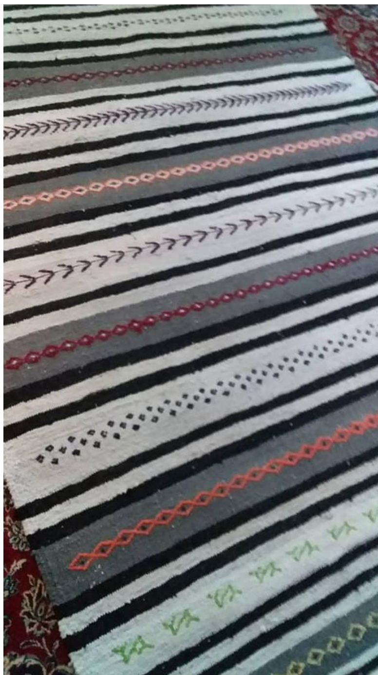
نمونه پلاس آماده فروش