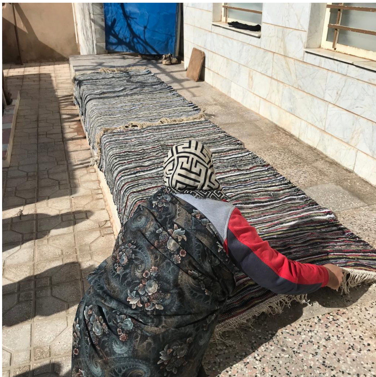
مرحله چهارم: پهن کردن پلاس ها