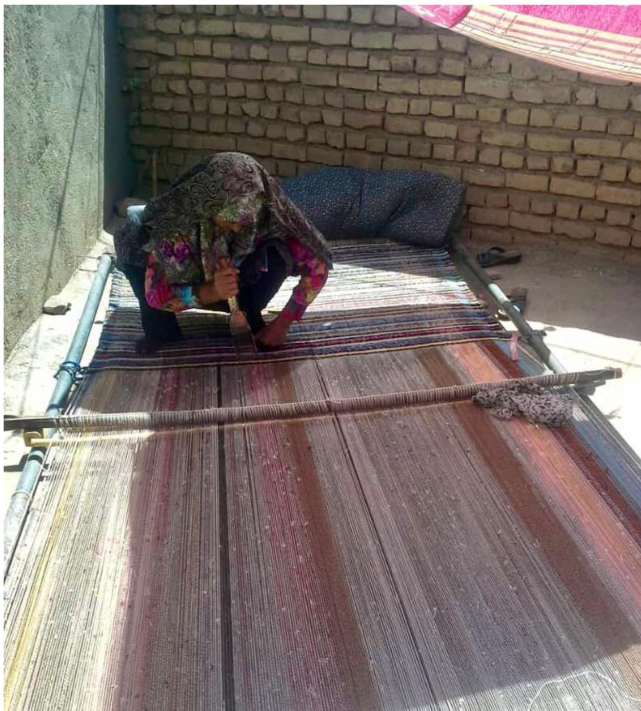
مرحله چهارم: بافت پلاس نشسته (۲)