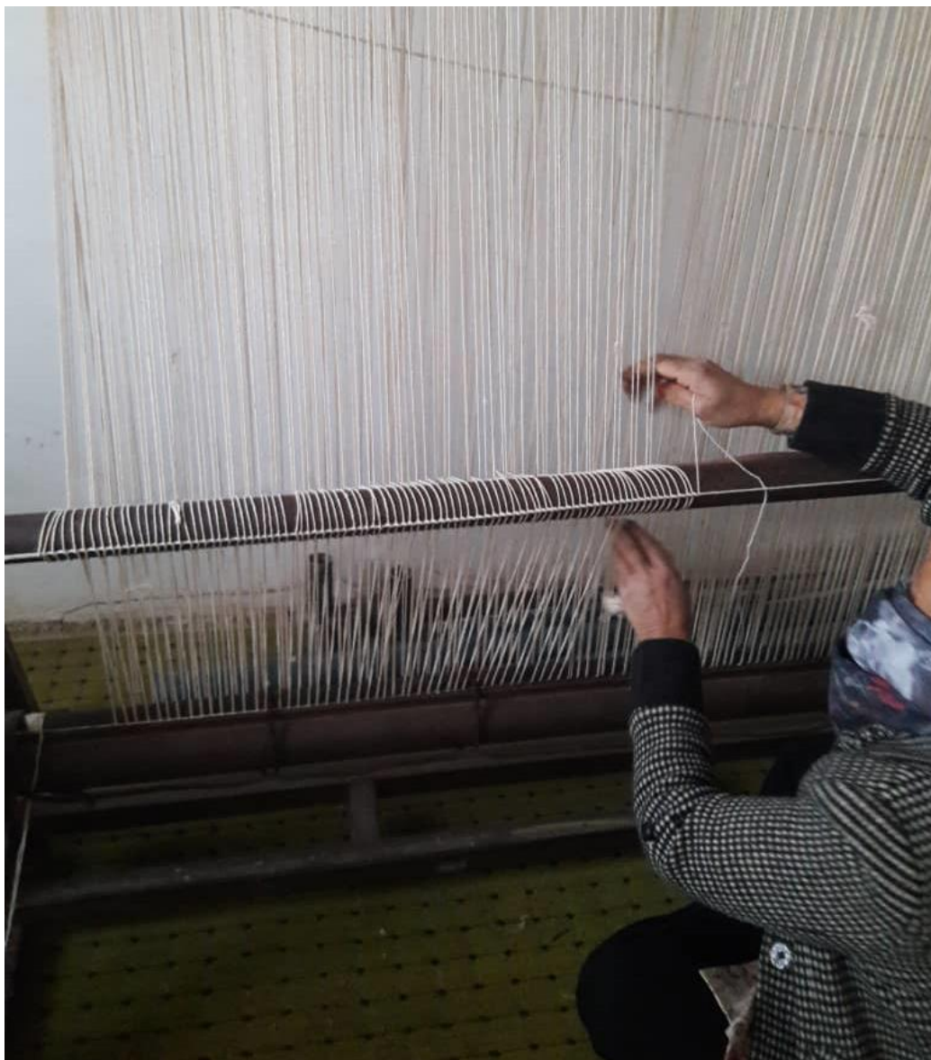
مرحله سوم: چله کشی (۲)