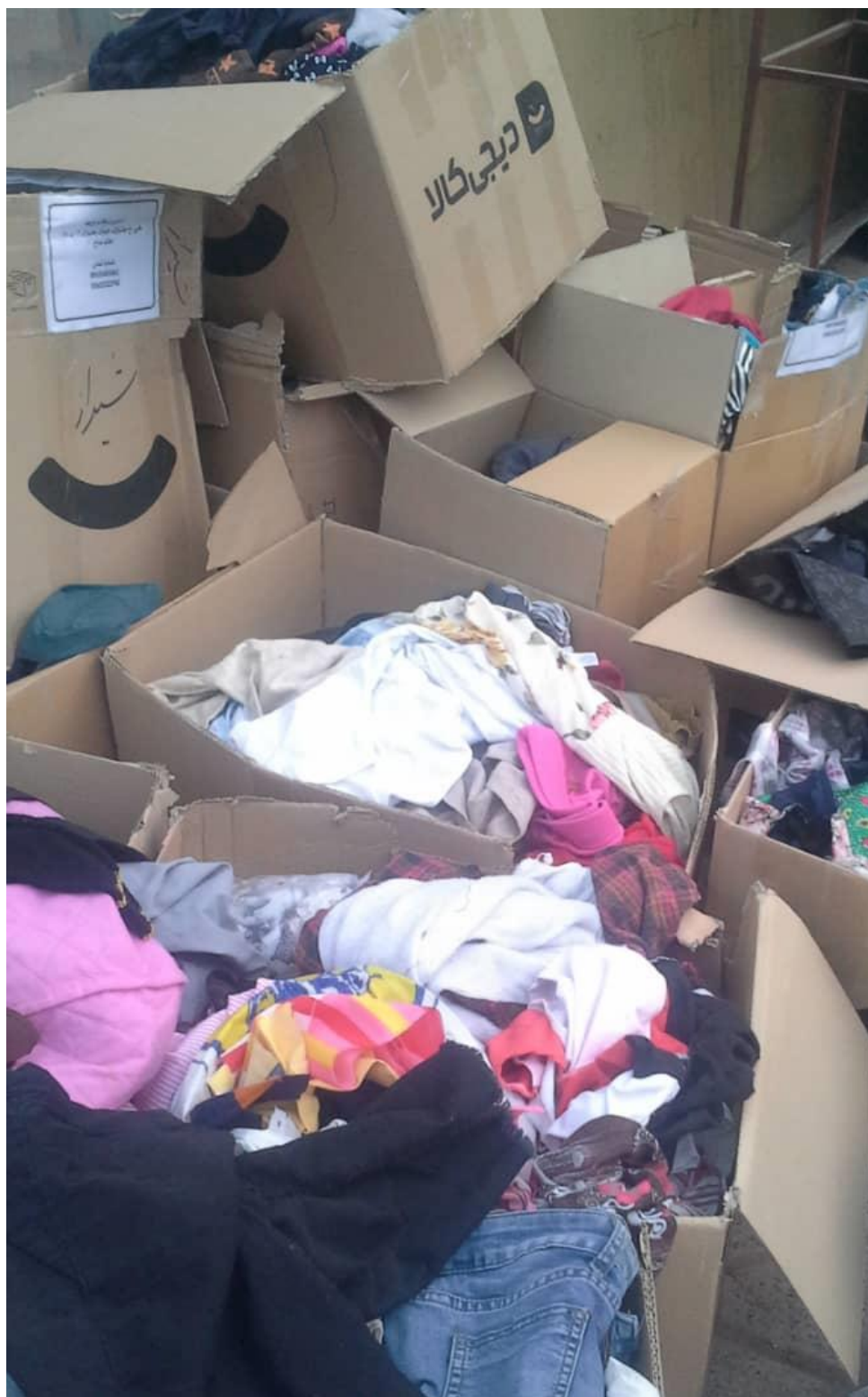
مرحله اول: ارسال پارچه‌ها و لباس‌های جمع‌آوری شده (۲)