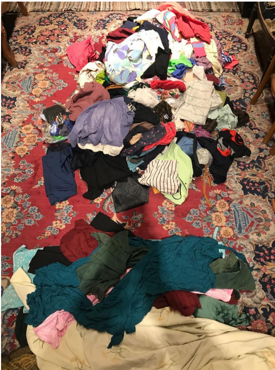
مرحله اول: جمع آوری پارچه و لباس کهنه (۱)