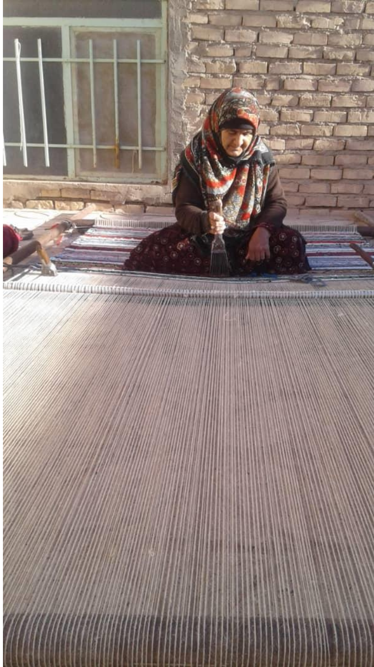
مرحله چهارم: بافت پلاس نشسته (۱)