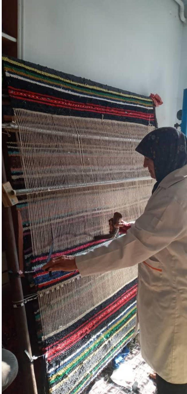
مرحله چهارم: بافت پلاس ایستاده (۴)