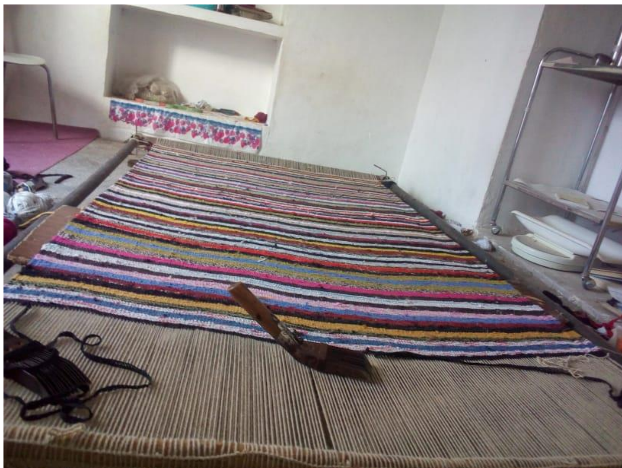
مرحله چهارم: اتمام بافت پلاس (۶)