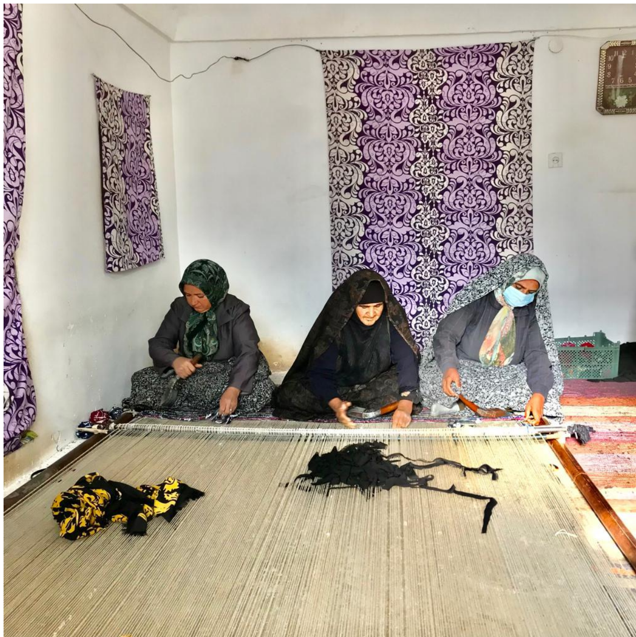
مرحله چهارم: بافت پلاس به صورت جمعی (۳)