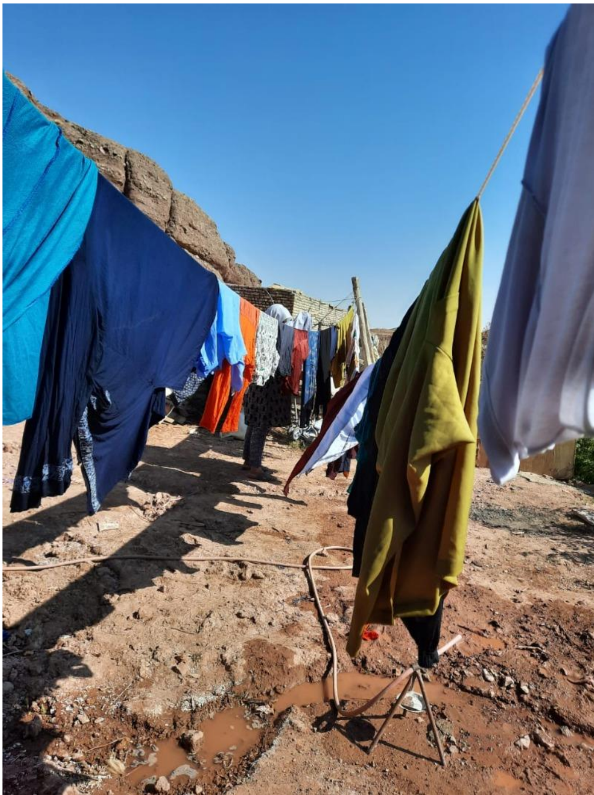
مرحله دوم: خشک کردن لباس‌ها و پارچه‌ها (۲)