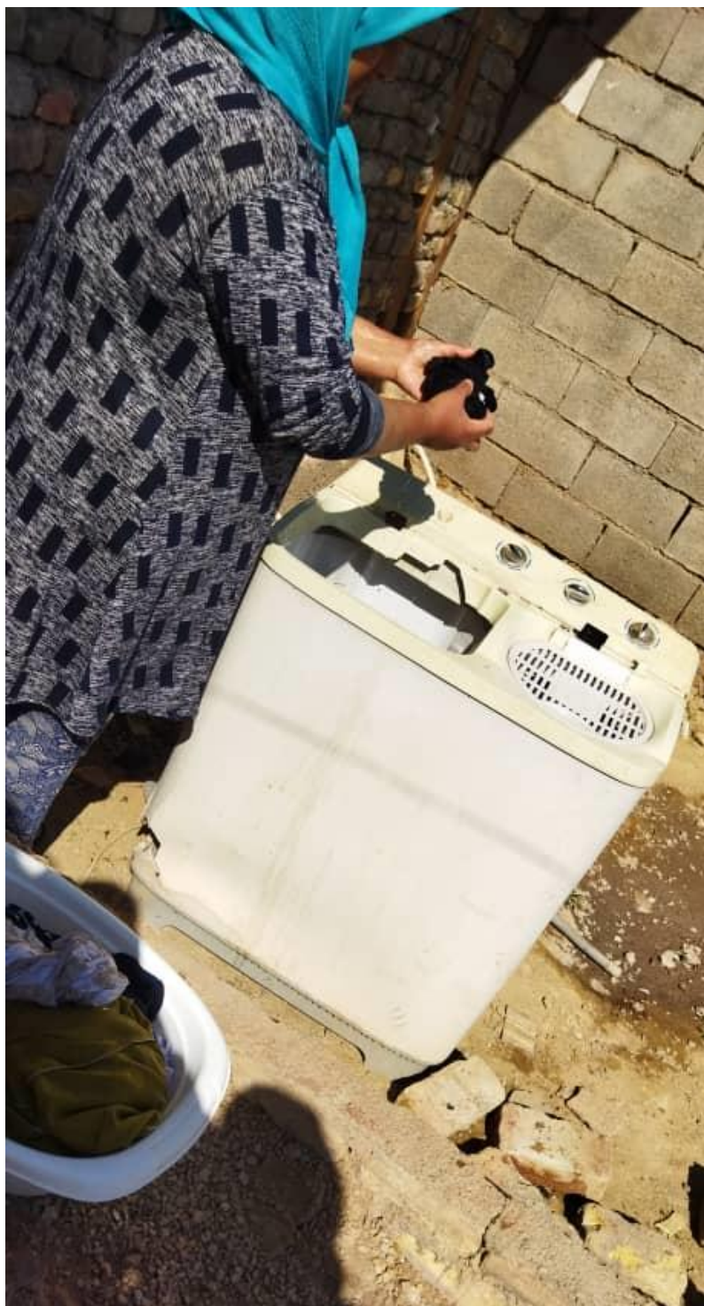
مرحله دوم: شستشوی پارچه‌ها و لباس‌ها (۱)