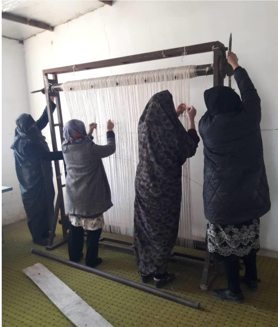
مرحله سوم: چله کشی (۳)